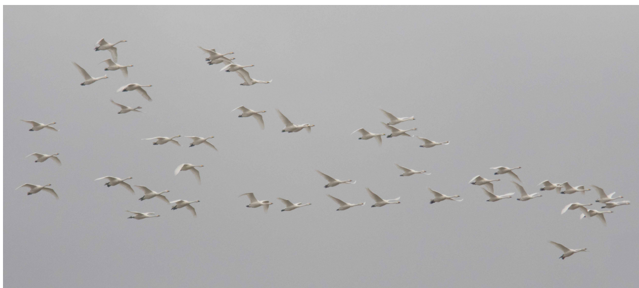
Pibesvaner, Hyllekrog 23. marts 2016

Antallet af Toppet lappedykker lå i år også meget lavt med kun 127 trk., mens det gik lidt bedre for Gråstrubet lappedykker (467), men dog kun i kraft af disse 2 gode dage: 9/4 110 og 14/4 226 (næsthøjeste tal fra lok). Med andre ord næsten trefjerdedele af sæsontotalen på 2 dage. Nordisk Lappedykker sås med i alt 10 trk.+ 1 rst. i tiden 26/2 – 13/4, hvilket netop er hidtil højeste træktotal, men samlet set ikke bedste år når både træk og rast sammentælles. Flest fugle sås 9/4 med 4 trk. Igen i år sås mange suler for stedet: 26/2 – 3/6 i alt 9 fugle. Det blev hidtil bedste år for Pibesvane med 339 trk. i tiden 8-24/3 med flest 17/3 80 og 21/3 78. Dens gulnæbbede fætter kom op på de sædvanlige beskedne antal (196) og her flest 7/3 89.