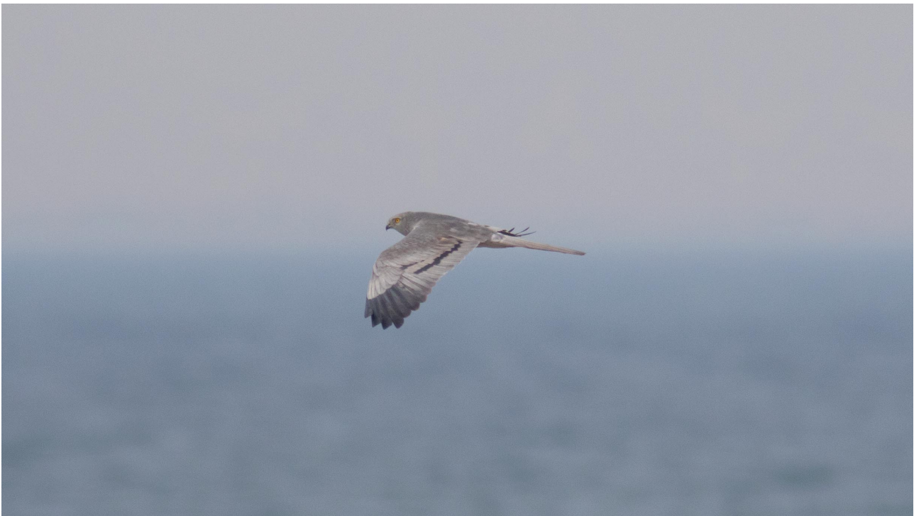
Hedehøg han, Saksfjed Inddæmning 3. maj 2016

Det blev til hidtil ringeste år for Havlit (742) med hele 55,2% under gennemsnittet! Største dag faldt igen i år tidligt med 1/3 178 trk. Derimod er Sortand (84.632) stadig rigtig godt kørende med 20 dage med over 1000 trk. (11/2 – 15/4) og her flest 25/2 5065, 21/3 9860 og 22/3 7000. Det gik også fint for Fløjlsand (598), som havde næstbedste forår, men her er de største trækdage temmelig beskedne (max. 14/2 34) p.g.a. et meget udstruktet træk igennem hele foråret. De næste 4. arter havde ligeledes deres næstbedste forår for lokaliteten, således både for Hvinand (492), Lille Skallesluger (38), Toppet Skallesluger (12.146) og Stor Skallesluger (271). Toppet Skallesluger havde desuden et meget bemærkelsesværdigt tidligt træk i år, hvor de største dage allerede lå med 14/2 1121, 26/2 530, 29/2 1265 og 1/3 732. Dog sås stadig en klar top i april måned: 10-15/4 i alt 1772 fugle og her flest 12/4 495. Antal trækkede fugle efter endt obstid blev ud fra opgjorte halvtimetotaler og lignende dage skønnet til ca. 1450. Som et forsøg blev direkte trækkede toppede skalleslugere i lighed med Ederfugl også kønsbestemt dette forår. I alt 7334 fugle ud af totalt 12.146 trækkende (60,4 %) blev bestemt og hunprocenten endte på 35,4 %.