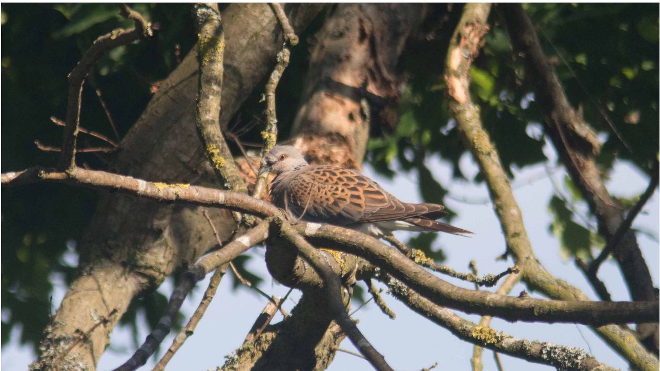
Turteldue, Saksfjed Inddæmning 2. juni 2016

Det mest interessante for alkefuglene i denne omgang var nok at Alk overhalede Lomvie for første gang siden tællingerne startede i 2008: Lomvie (35), Alk (41), Alk/Lomvie (19) og Tejst (3).