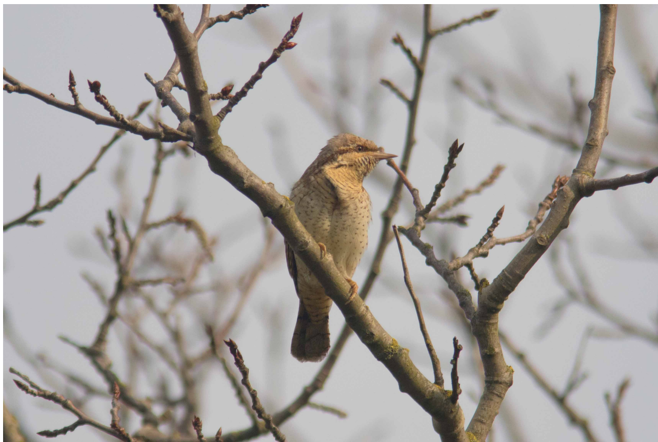
Vendehals, Saksfjed Inddæmning 3. maj 2016

på direkte træk. Et rasttal af Huldue kan dog nævnes 6/3 116 rst., som sikkert er vinterflokken fra Bjernæs Husby (her op til 170) på udflugt.