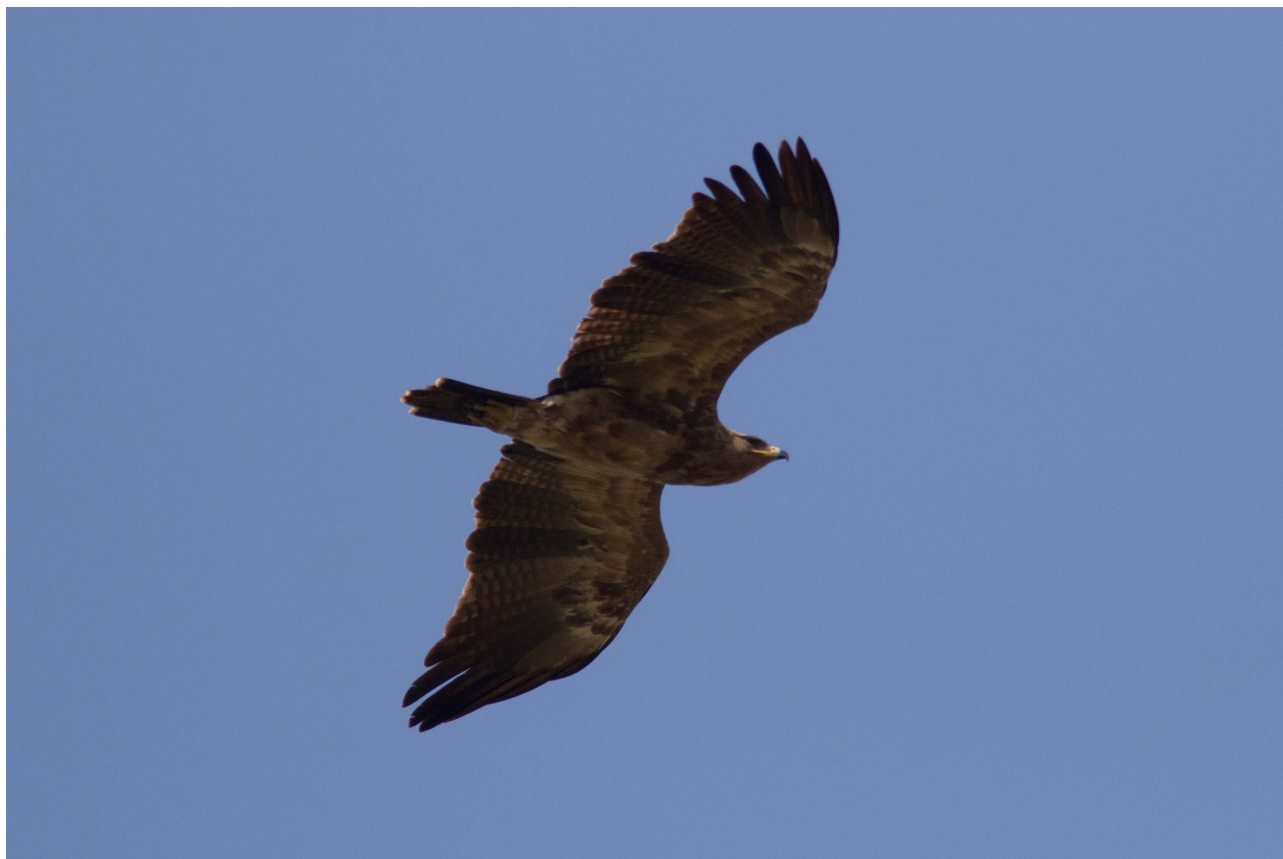
Lille Skrigeørn 3K, Hyllekrog 14. maj 2016

Vintervejr var der ikke meget af i år, da frost, sne og is var indskrænket til perioden ca. 29/12 og kun frem til 23/1. Herefter et par dage med tåge efterfulgt af nærmest forårsvejr allerede fra den 25/1 (op til +5 gr.). Selvom den efterfølgende periode frem til 10/2 var meget mild, var den mest præget af regn og kraftig blæst, hvorfor der først blev startet op med trækobservationerne på denne dato. Der har således i denne tidlige periode nok alligevel i alt passeret et par tusinde fugle af de tidlige arter, især andefugle (f.eks. Ederfugl og Sortand).