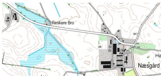
1:25.000 kort over området.

Mange af os har kørt forbi denne mindre lokalitet uden at bemærke den. Med fire kilometer i timen og øjnene på trafikken på Orevej mellem Stubbekøbing og Næsgård, overser man let en lille parkeringsplads (N 54.8717, E 12.1012) på vejens sydside. Lokaliteten var også overset i DOFbasen indtil for nylig, hvor et af vores medlemmer gjorde opmærksom på den. Og nu er engene blevet oprettet som en selvstændig lokalitet i DOFbasen. Derfor vil vi gerne have nogle flere oplysninger om fuglelivet, for det er en lille naturperle, der ligger her.