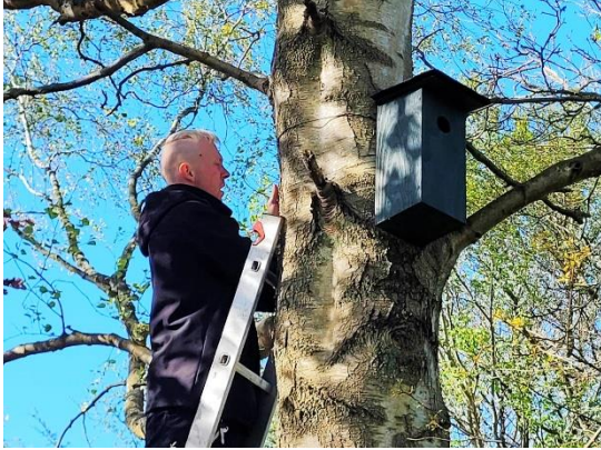
En stærekasse kommer op.

med masser af godt fuglekrat og nogle med åbent agerland. Det kunne være sjovt at registrere udviklingen af arter derude over tid. Denne gang koncentrerede vi os om ophængningen.