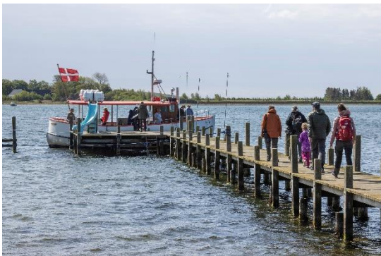
På vej til næste destination – postbåden venter.

Nu var der ikke langt til øen Enehøje. Vi havde ikke gået længe på øen, før en våge viste sig på himmelen. Var det "bare" en Musvåge, eller? Vi så den i lang tid bagfra, så det var svært at afgøre. Men de hængende vinger skabte en mistanke om Hvepsevåge. Endelig begyndte den at kredse rundt, og så var der ikke nogen tvivl. Det var en trækkende Hvepsevåge med lang hale og en karakteristisk sløv, "spøgelsesagtig" flugt. Postbådens skipper fortalte om Grønlandsfareren Peter Freuchen, som i sin tid ejede øen og skrev nogle af sine fantasifulde bøger i et karakteristisk blåt hus, som vi kunne se i baggrunden. Vi fik også historien om hvalkæberne, som er opstillet på et højt punkt for at fungere som sømærke på grønlandsk vis.