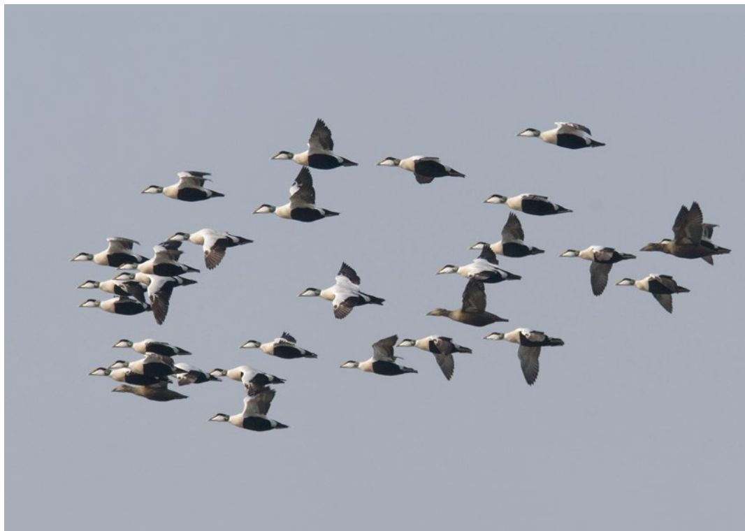
I forårene 2013 og '14 var der dobbelt så mange hanner som hunner blandt de mere end 330000 østtrækkende Ederfugle ved Hyllekrog.

forårstræktotal. For denne periode har jeg sat hunandelen til 19 % stigende til 21 % i løbet af perioden. Bemærk at dette skøn ikke har kunnet efterprøves i 2014, da det blev et tidligt forår og samtidigt meget mildt, hvorfor trækket forløb ganske anderledes end i 2013. På baggrund af disse tal blev den samlede hunprocent for hele forårsperioden 2013 udregnet til (maksimalt) 33,9 %. I 2014 var den samlede hunprocent tilsvarende 33,1 %.