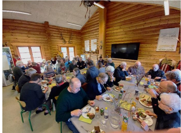
Vi startede med en god frokost.