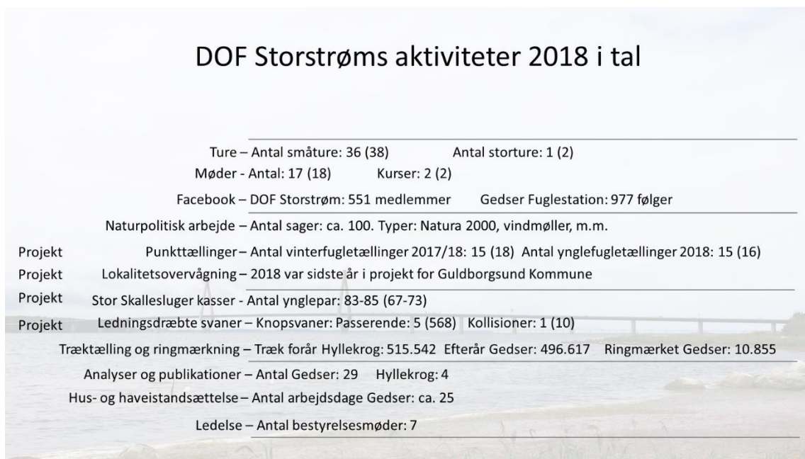
Figur 2. Antal af forskellige aktivitetstyper i DOF Storstrøm i 2018.

I november 2018 var vi 1.028 medlemmer. I løbet af året meldt 64 sig ind og 59 meldte sig ud.