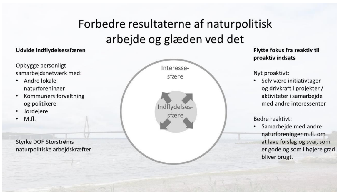
Figur 4. Eksempler på, hvordan vi vil forbedre vores naturpolitiske arbejde.

Det naturpolitiske arbejde har flere af de aktive udtrykt frustrationer over. Det gælder både de manglende resultater af indsatsen, det meget alene-arbejde og manglen på værdsættelse.