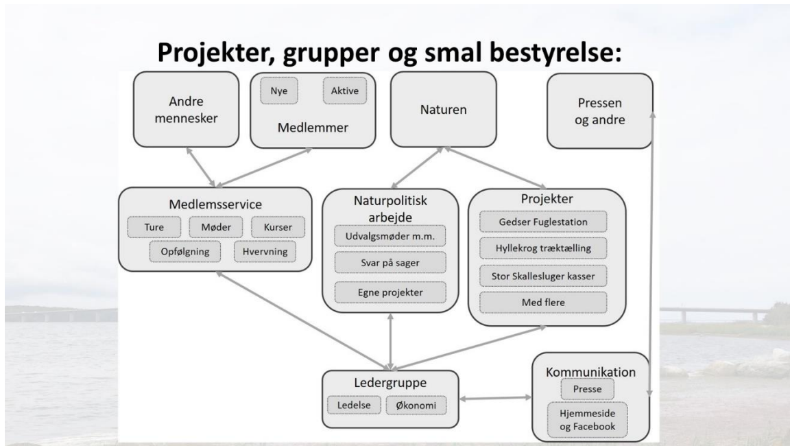
Figur 5. Skitse af DOF Storstrøm organisation.

bestyrelsesmøderne. Der vil derfor ikke være behov for ret mange i bestyrelsen. Bestyrelsen skal mest stå for de ledelsesmæssige opgaver rent foreningsmæssigt og for at hjælpe og koordinere de andre aktives indsats.